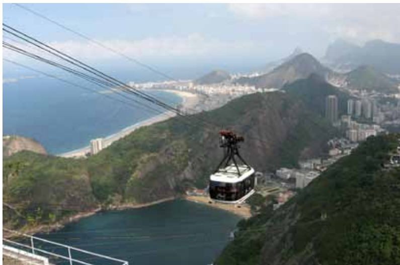
Á toppi Pao de Acucar, til vinstri er Copacabana og sjá má hvernig borgin flæðir milli fjallanna.