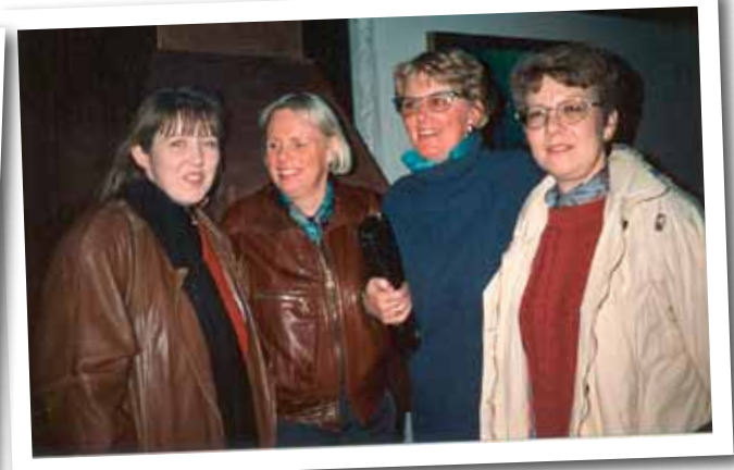
Læknaritarar frá Sauðárkróki.