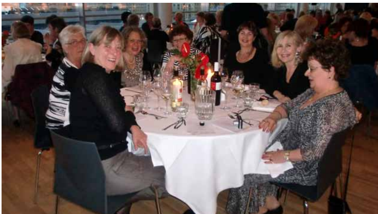
Lokahóf á ráðstefnu lækningarara í Kaupmannahöfn.