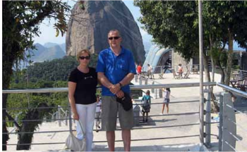
Við hjónin með Sykurtoppinn í baksýn.

Að morgni 26. júlí flugum við til Rio de Janero. Beta litla varð eftir hjá ömmu og afa. Lentum þar um hálf átta um morguninn. Ákveðið var að fara strax upp að Kristsstyttni með leigubíl, því veðrið var gott og heiðskírt. Útsýnið frá styttni er engu líkt og styttn hvít og falleg, enda nýbúið að hreinsa Krist. Seinna í ferðinni fórum við svo aftur upp að styttni, þá fórum