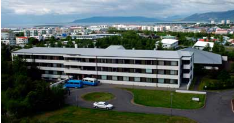
Á endurhæfingardeild LSH á Grensáasi fer m.a. fram mat og endurhæfing eftir heilaáverka og eftirfylgd eftir þörfum.