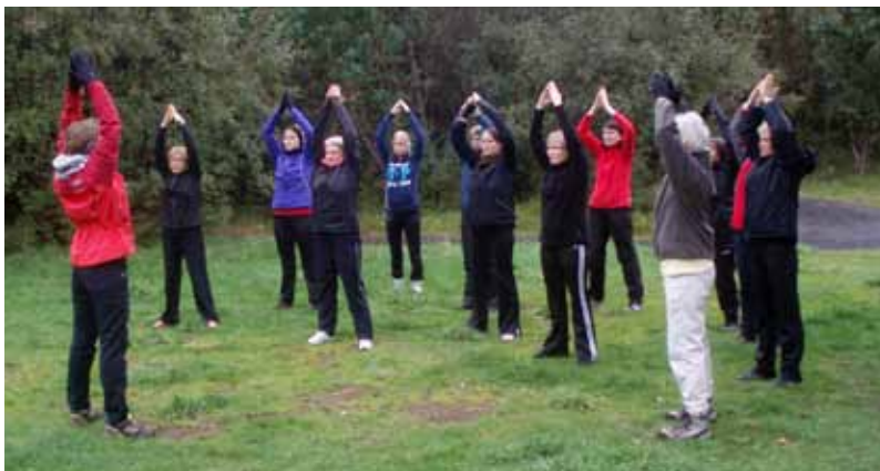
Það eru einstakar náttúruperlur innan seilingar hér á höfuðborgarsvæðinu. Það er endurnærandi og dásamlegt að gera æfingar í fallegu skógarjórðri í Elliðaárdalnum.