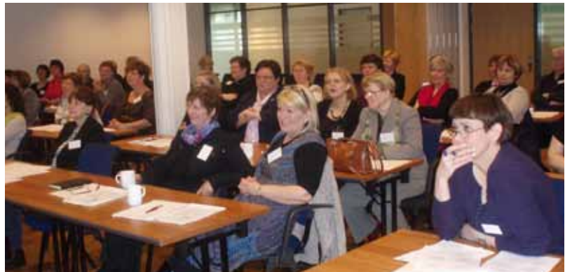
Það var góð mæting á vel heppnaða námsstefnu FÍL í apríl sl.