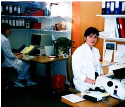
Svipmynd úr starfi læknaritarara á Heilsugæslustöðinni á Akranesi árið 1982.

Samkvæmt lögum ber að halda sjúkraskrá. Var það gert með mismunandi hætti hér á árum áður og segja má að vinnubrögðin hafi verið frekar frumstæð. Handskrifuð spjöld voru algengustu sjúkraskrárnar bæði á sjúkrahúsum og hjá heimilislæknum. Vinna þessi tók mikinn tíma hjá læknum auk þess sem handskrifaðar nótur voru misjafnar, sumar vel skrifaðar, aðrar illa og því gjarnan illskiljanlegar. Á meðal fyrstu verk-efna læknaritarara var að koma í skiljanlegt form misjafnlega vel skrifuðum eða dikteruðum nótum ásamt mörgum fleiri verkefnum. Starfsheitin voru læknaritari, yfir-