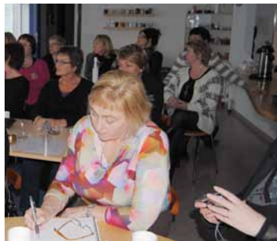
Frá fundi Norðurlandsdeildar í október 2010.