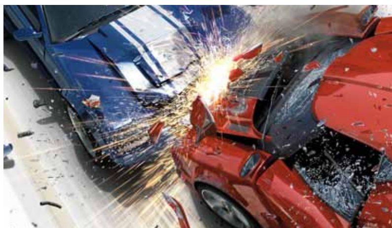
Umferðarslyss eru algengasta orsök heilaáverka.

frumkvæði, hömluleysi í tali og hegðun, örlyndi, skert úthald, fólk þreytist fljótt og þolir stundum illa áreiti. Hugrænu einkennin eru þau einkenni sem geta verið hvað erfiðast að eiga við og reynast ekki síður aðstandendum erfið. Vegna þessara einkenna geta einstaklingar með heilaskaða þurft meira eftirlit í daglegu lífi og stuðning. Oft verður töluverð breyting á persónuleika einstaklingsins og það reynir á aðstandendur. Hætta er á félagslegri einangrun þar sem þessi hugrænu vandamál gera fólk erfið fyrir í félagslegum samskiptum, t.d. í námi og vinnu þar sem reynir á þá þætti. Stundum er talað um dulda fötlun í þessu sambandi þar sem hún er ekki líkamleg, hún „sést ekki utan“ á einstaklingnum og hann kemst sinna ferða eins og áður. Oft er um fremur unga einstaklinga að ræða sem eru í námi eða vinnu og eiga lífið framundan. Heilaskaðinn getur þannig haft mikil áhrif á líf fólks og það verður háðara öðrum í öllu daglegu lífi.